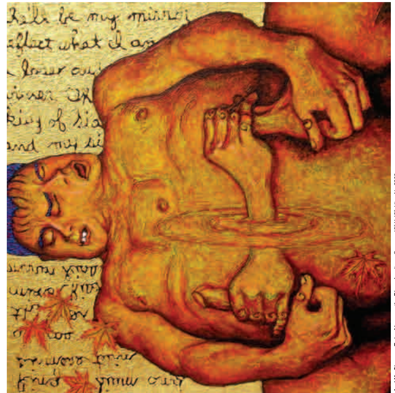
And My Siamese Twin, Alone on the River, Acrylic on Canvas, 12" X 12", Hien N., 2003